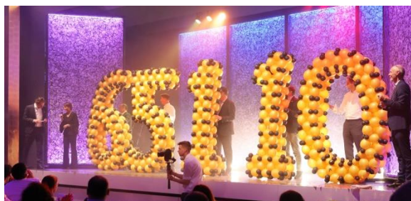
Comedy Night des Lions Club Zürich-Waldegg

Dank Anlässen und tollen Sammelaktionen durften wir wunderbare Spenden entgegennehmen – und sogar ein Lebensfreude Auto!