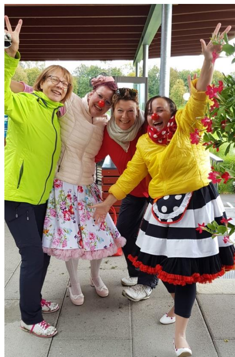
Das schon fast traditionelle Golfturnier in Lipperswil