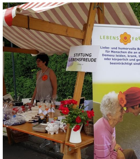
Tombola Stand am Mittsommerfest Frauenfeld